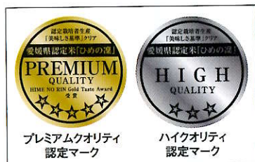
プレミアムクオリティ 認定マーク

収穫されたお米は、通常行われる農産物検査だけでなく、食味を分析し「美味しさ基準」により3つのランクに区分するなど、美味しいお米を消費者に届けるために、県・JA・生産者が一丸となって取り組んでいます。