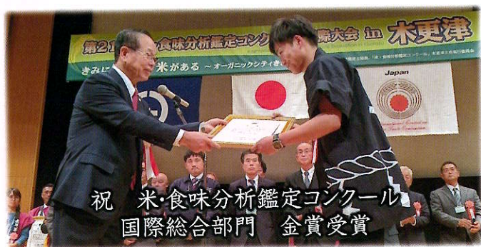
祝 米・食味分析鑑定コンクール 国際総合部門 金賞受賞

令和元年以降も“ひめの凩”は同コンクールで、数多くの賞を受賞しており、高い食味評価をもつ品種として注目を集めています。