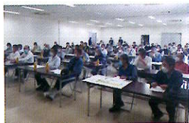
認定栽培者講習会

“ひめの凩”は、愛媛県が美味しい米づくりへの意欲にあふれる方々を認定栽培者として認定し、その方々だけが栽培をしています。認定された栽培者は、“ひめの凩”の実力をしっかりと引き出すため、講習会に参加し、栽培マニュアルや県・JAの指導を遵守し、愛情を込めて栽培をしています。